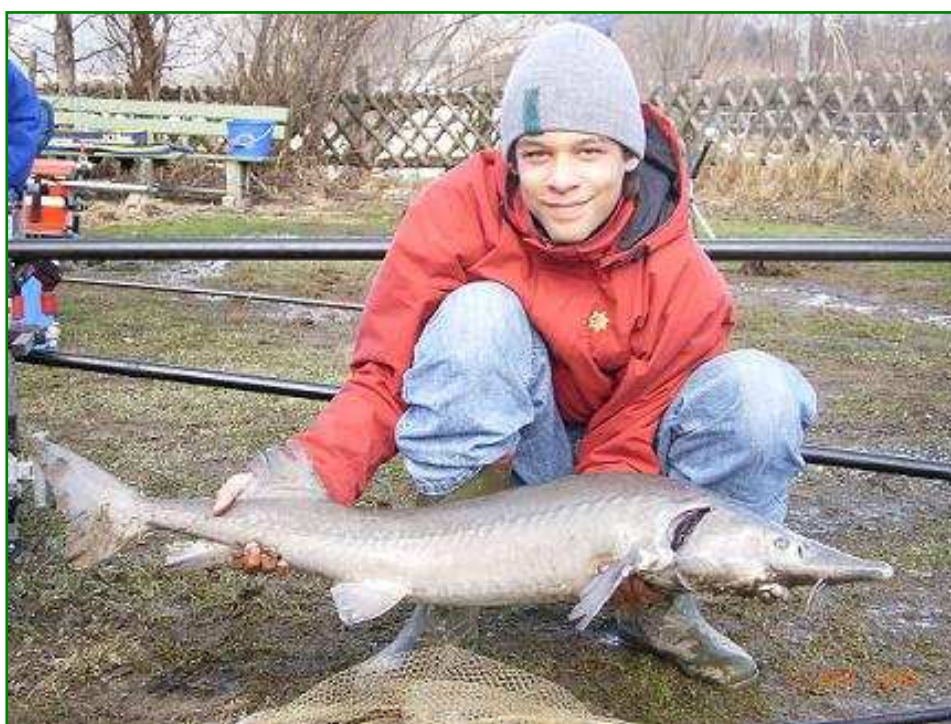
Auch Fischer mit geringen Vorkenntnissen fangen am Angelteich Haid kapitale Störe