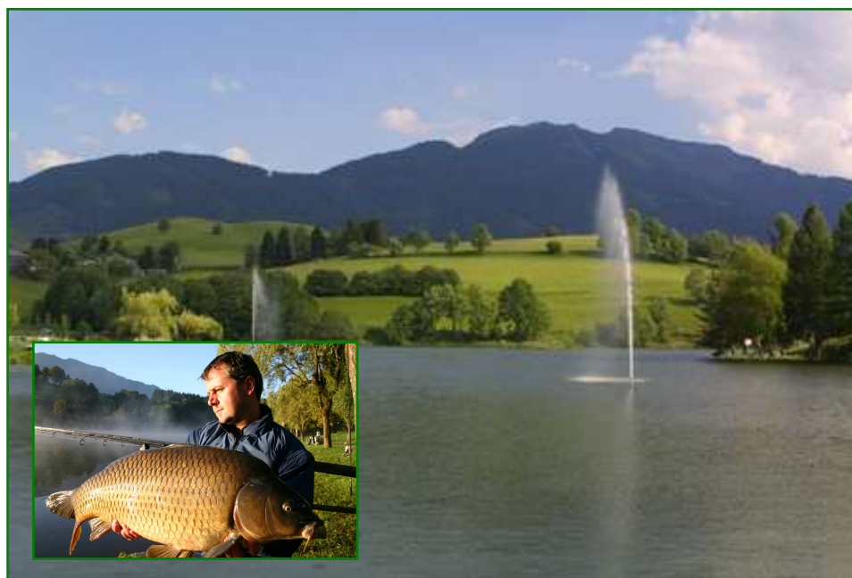
Der Ritzensee in Saalfelden – ein Eldorado für Karpfenangler